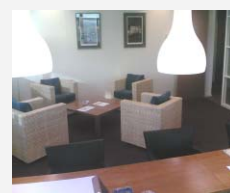
Interieur van de Ace! trainingslocaties